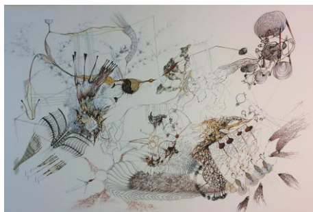
Romana del Negro, Zeichnung 7 [Dessin 7], 2005 © l'artiste

Cette deuxième salle présente des thèmes que l'on aurait qualifiés autrefois de typiquement féminins : une vue de Hertenstein, un paysage enneigé, un chat, une toile d'araignée, des fragments de fleurs desséchées, une nature quelque peu mystique. Ces six travaux audacieux questionnent la perception du réel, tout en déstabilisant habilement et subtilement les repères du spectateur.