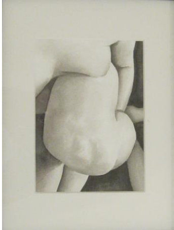
Anouk Richard, Intime V , 2015

Le corps a été à la base de nombreuses revendications de la part des femmes, notamment pour son statut d'objet du regard masculin. L'érotisation de l'image de la femme dans la culture populaire a été dénoncée par l'art féministe. Beaucoup d'artistes ont alors travaillé sur ce sujet en cherchant à désacraliser ce corps afin de lui rendre son caractère sensible et naturel et de proposer une nouvelle iconographie.