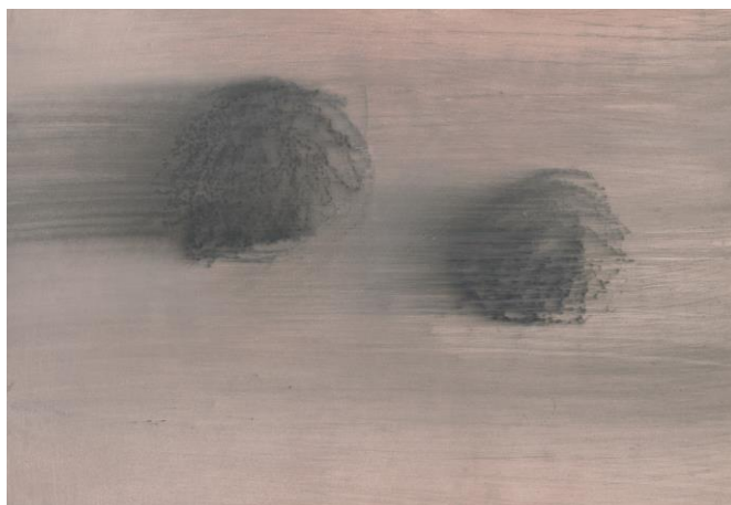
Mireille Henry, Sans titre , 2005 © l'artiste

L'exposition Entre femmes ! s'inscrit dans les présentations thématiques longue durée instaurées par le Musée jurassien des Arts depuis 2015. Puisés dans le riche patrimoine conservé au musée, les travaux sélectionnés ont été réalisés uniquement par des artistes femmes. Le dialogue entre les œuvres et le public y sera souligné, avec la création de carnets didactiques et de mallettes d'activités.